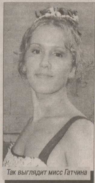
Так выглядит мисс Гатчина